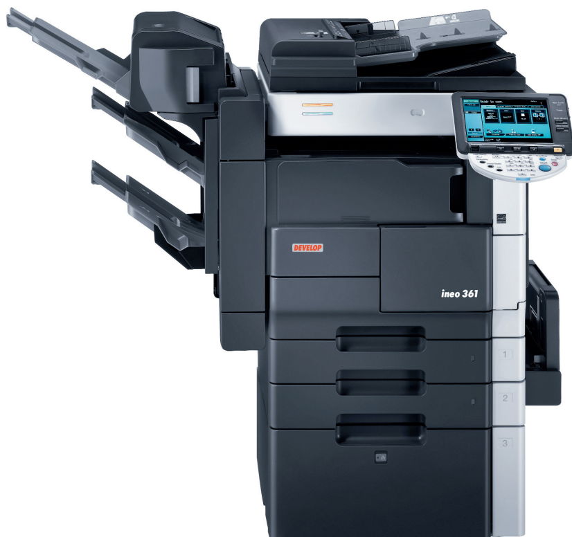
iNeo361 со встраиваемым финишером FS-522, устройством буклетирования SD-507 и активной тумбой большой ёмкости PC-407.

iNeo 361 / 421/ 501 достаточно компактны (благодаря встраиваемому финишеру) и очень легки в эксплуатации (здесь особое спасибо следует сказать большой цветной сенсорной панели управления). В однообразном мире черно-белых офисных систем все эти необычные функции и отличают Develor iNeo 361 / 421/ 501 от других подобных машин.